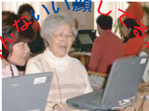
デイサービスセンターの講座風景