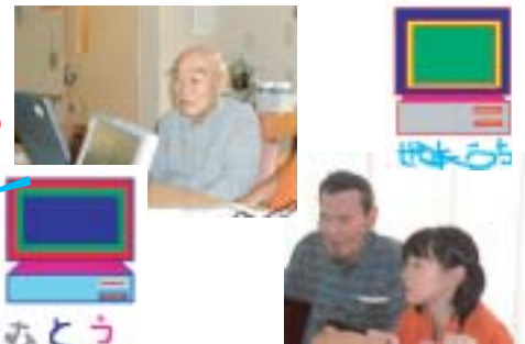
デイサービスセンターの講座風景

日時：【2月コース】(ワード応用編) 2/7(火)・14(火)・21(火)・28(火) 【3月コース】エクセル応用編 3/7(火)・14(火)・21(火)・28(火)