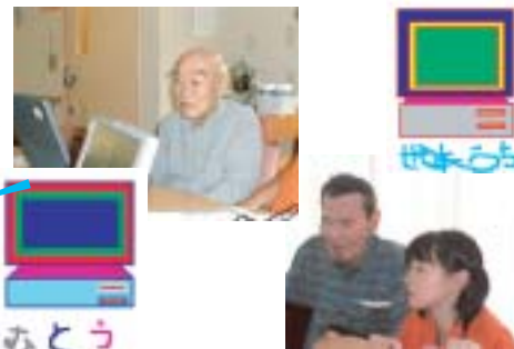
デイサービスセンターの講座風景

日時：【10月コース】パソコンの基礎） 10/4(火)・11(火)・18(火)・25(火) 【2月コース】応用編1） 11/29(火)・12/6(火)・13(火)・20(火) 【11月コース】年賀状作成） 11/1(火)・8(火)・15(火)・22(火) 平成18年1月コース】応用編2） 1/10(火)・17(火)・24(火)・31(火)