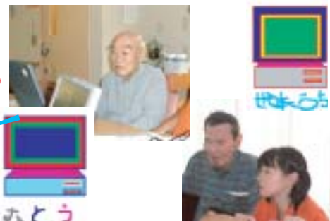
デイサービスセンターの講座風景